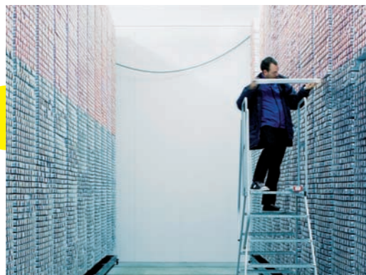
IODP-Bohrkernlager im Zentrum für Marine Umweltwissenschaften Fotograf: Tom Kleiner, Jahrbuch 2005