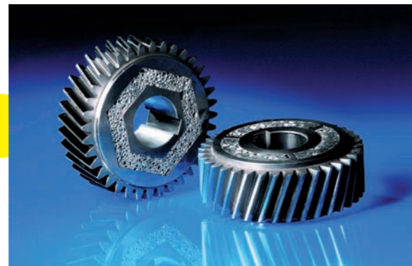
Zahnrad mit „Flüsterfüllung“: Verbundlösung aus Aluminiumschaum und Stahl, Fraunhofer IFAM

Neue Hochleistungswerkstoffe und Fertigungsverfahren entwickeln sich in zunehmendem Maße zum Hauptträger für den technologischen Fortschritt. Das Fraunhofer IFAM befasst sich nunmehr fast vierzig Jahre mit verschiedenen Aspekten der Materialforschung. In dieser Ausstellung zeigt sich eine ganz andere Seite der Materialforschung: Das Wechselspiel zwischen Wissenschaft und Ästhetik in der fotografischen Illustration. Die Darstellung von wissenschaftlichen Ergebnissen in all der Fülle und Schönheit ihrer Erscheinungsmöglichkeiten gaben den Anstoß zu dieser Ausstellung. Zu sehen vom 15. November bis zum 8. Januar 2008.