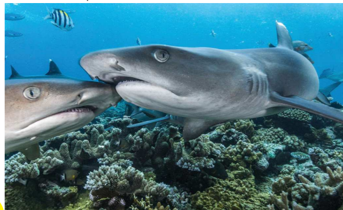
Faszination Haie

Mit einer Bilderserie zu seiner Forschung über junge Haie gewann der Meeresbiologe und Fotograf Tom Vierus in 2016 den Deutschen Preis für Wissenschaftsfotografie in der Kategorie „Reportage“. Nun zeigt er gemeinsam mit dem Leibniz-Zentrum für Marine Tropenforschung (ZMT) eine Auswahl beeindruckender Nahaufnahmen von Haien. Die Ausstellung informiert über die Welt der Haie, ihre Gefährdung und Möglichkeiten, sie zu schützen. Am Beispiel eines Projektes auf Fidschi macht sie deutlich, wie wichtig ihre Erforschung ist. Doch vor allem fasziniert sie mit spektakulären Aufnahmen dieser weltweit bedrohten Tiere. Zu sehen vom 15. September bis zum 16. November.