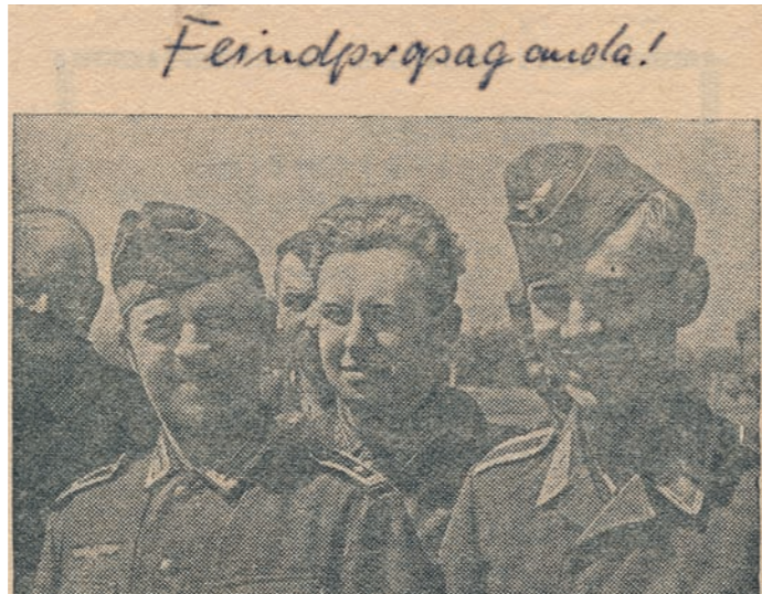
Passierschein „Sie töten nicht mehr die anderen...“, 1941, FSO 01-003

Am 7. Juli um 18 Uhr ist die Eröffnung der Ausstellung „Achtung! Feindpropaganda!“ Lew Kopelews Frontflugblätter 1941 – 1945 im Haus der Wissenschaft. Die Flugblätter, die jenseits der Frontlinie abgeworfen wurden und von den deutschen Soldaten mit „Feindpropaganda“ gekennzeichnet werden mussten, handeln u.a. von Siegen und Verlusten an den Fronten, von Bombenangriffen auf die Heimat, dem Leben der Kriegsgefangenen und den Gefahren des russischen Winters. Die sowjetische Propaganda nutzte Fotos und Feldpostbriefe und gestaltete die Flugblätter auch mit Illustrationen, wie Karikaturen und Fotomontagen. Die Ausstellung beleuchtet schließlich, was deutsche Gefangene in der Kriegsgefangenschaft erwartete und was Kopelew selbst nach seiner Verhaftung erlebte. Zu sehen bis zum 30. August.